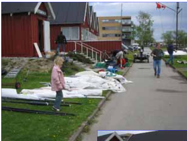
Sejl og master er lagt frem til kontrol