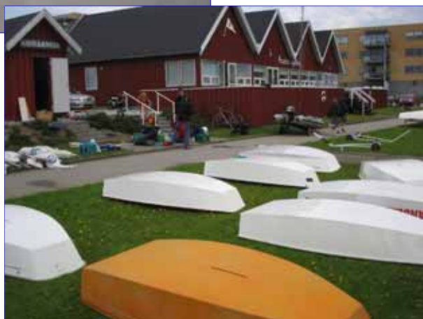
De nypolerede joller