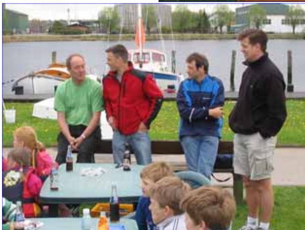
For fædrene var der også tid til lidt småsnak