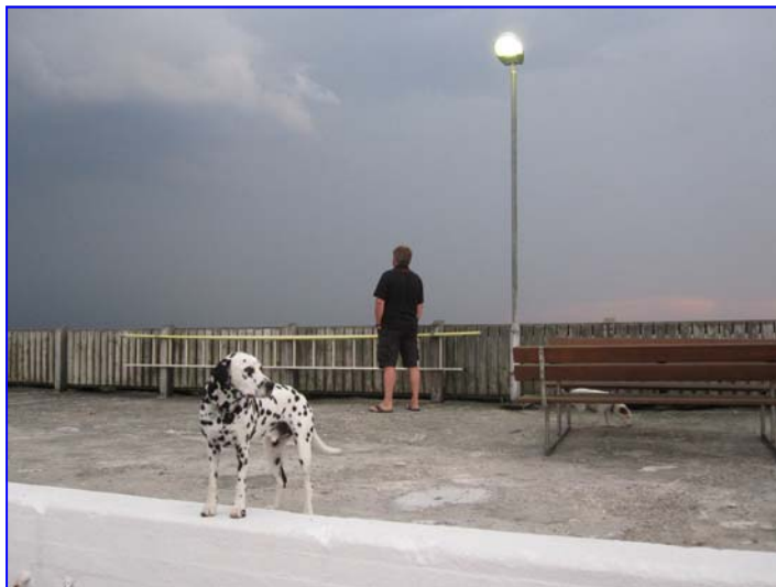
Tursejlads: Frits Dalmose.