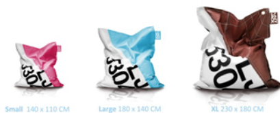
Small 140 x 110 CM