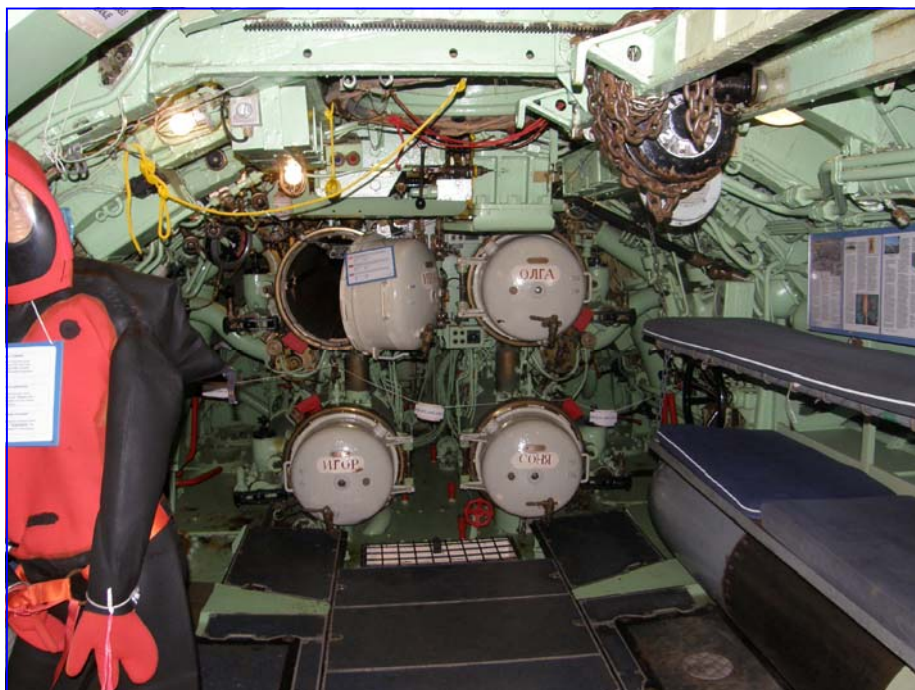
Torpedorørene i forskibet. Mandskabet sov ved siden af og mindst to mand delte en køje