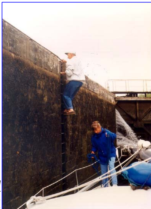
Bodil sejlede til Costa del Sol 3 mdr. efter ny hofteoperation - det gik fint, også med sluselejerne.

På Danske bådejeres hjemmeside: danskebaadejere.dk kan mange oplysninger nu hentes.