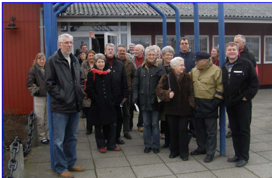
De fleste af deltagerne uden for Aalborg Marinemuseum

os til bordet og fik serveret en lækker middag, til forret var der flot fisketal-lerken med lidt suppe, kogt fisk på rodfrugtebund og nedkogt balsamico, det var rigtig flot og smagte lækkert, så fik vi kalvekød i tern og vildtsauce med nye kartofler og lidt salat. Derefter kørte vi med bussen ud til marinemuseet ved skudehavnen. Der blev betalt for indgangen og så kunne vi ellers bare gå rundt og se alle de spændende ting på Danmarks største marinemuseum. Der var meget om Ålborg havns historie, hvordan den havde set ud for flere hundrede år siden helt op til i dag. Der var modeller af mange af de skibe der gennem tiden er blevet bygget på Ålborg værft og udenfor lå en af flådens forhenvæ-