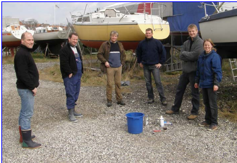
De nye elever på "Filur" planlægger klargøring