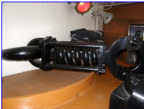
Elbjørn bugserede også skibene gennem isen, så der var virkelig brug for noget kraftigt gods. Denne krog er til trossen agterud