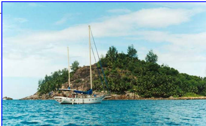
"Little Swan" for anker i Baie Lazare Mahé Island

Vi sejler begge både vest og nord om Praslin Island til Curieuse Island og anker i endnu en skøn bugt. Her er det ikke tilladt at gå iland. Mange steder på Seychellerne er udlagt til marine parks som er fredede områder med adgang