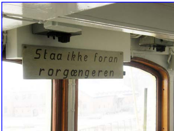
Så selvfølgelig, men der har sikkert en gang i mellem været gæster ombord på isbryderen.

rende ubåde og en torpedobåd der var åbent ned til messerne og broen, men man kunne ikke komme ned og se maskinerne. Her kunne vi få lov til at gå rundt indtil kl. 16, men allerede kl. 15 sad næsten alle og ventede på